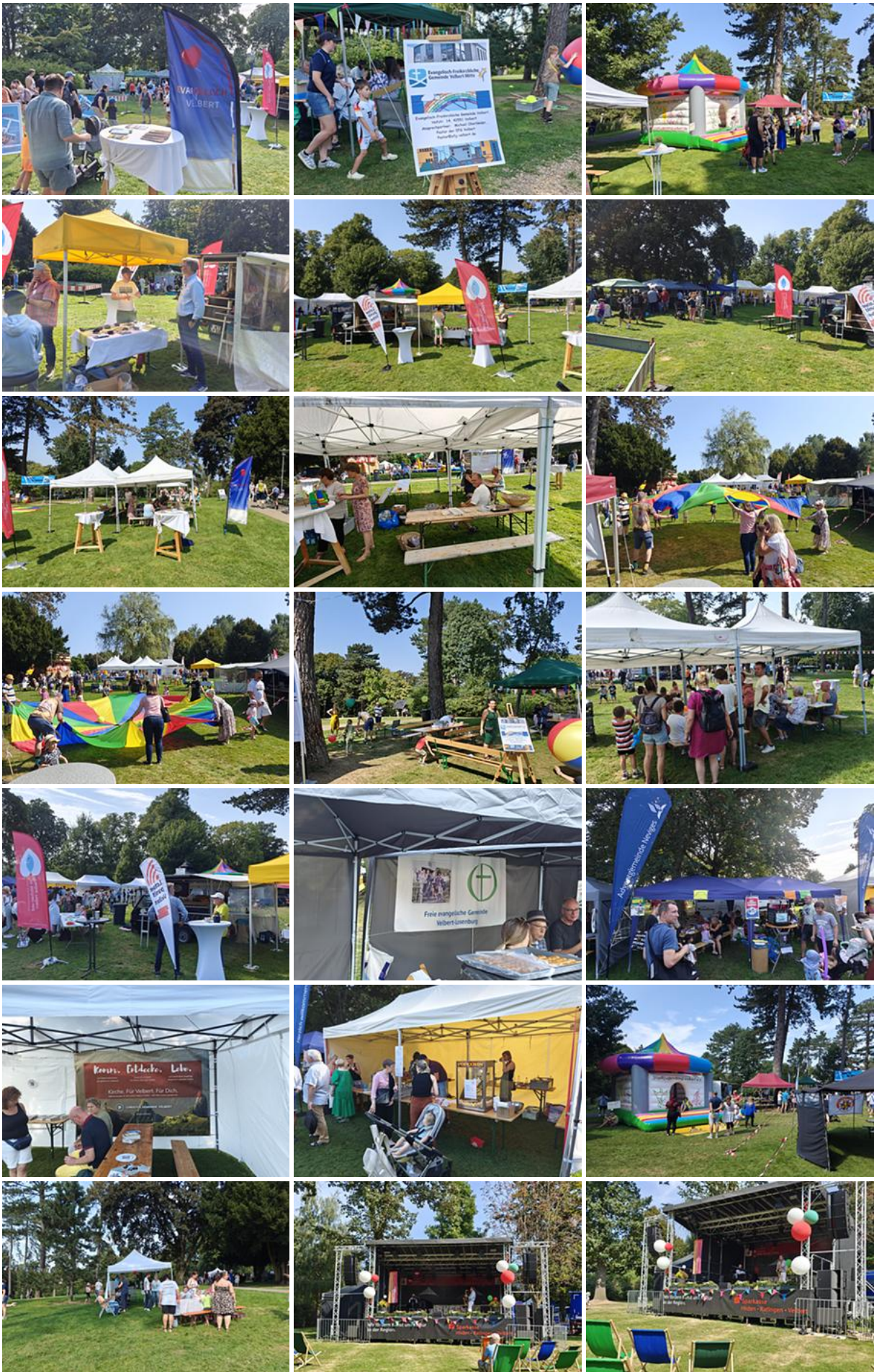
Velberter Stadtfest im Herminghauspark: Christen präsentieren sich durch eine Kirchenmeile