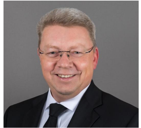
Bischof Olaf Koch