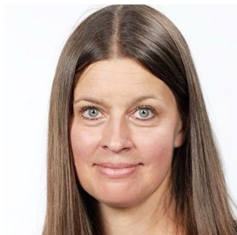
Carola Gabelin Bezirks-Orchester